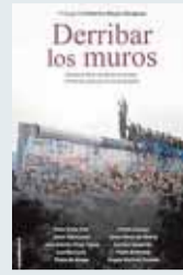
DERRIBAR LOS MUROS Varios autores. Ed.: Roca. 232 páginas. Precio: 15,90 euros (ebook, 7,99)

Ece Temelkuran es una escritora turca que fue despedida del diario en el que trabajaba por sus críticas a Erdogan. ‘Cómo perder un país’ es un ensayo planteado como un manual de instrucciones en el que explica los pasos que hay que dar para que el populismo y el nacionalismo triunfen en la corrosión de un sistema de libertades y logren que una nación deje de ser una democracia para convertirse en una dictadura. Dichos pasos son siete: la creación de un movimiento político; el asalto a la lógica y al lenguaje; la instauración de la ‘pos-verdad’; el desmantelamiento de los mecanismos judiciales y políticos; el diseño de un modelo de ciudadano; el grado de envilecimiento que lleve a este a irse del horror y la construcción de un país a la medida del sátropa.