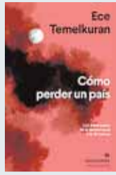
CÓMO PERDER UN PAÍS Autora: Ece Temelkuran. Ed.: Anagrama. 280 páginas. Precio: 18,90 euros (ebook, 9,99)

En ‘El Diablo sabe mi nombre’, la salvadoreña Jacinta Escudos reúne catorce relatos que tienen en común la transgresión de las fronteras marcadas por la literatura realista. En ellos, todo es posible, desde los desdoblamientos mágicos de los personajes a las mutaciones y transfiguraciones físicas; desde las más desconcertantes realidades paralelas a las más pavorosas prácticas antropofágicas. Pero, pese al carácter genuinamente irracional, anti-conventional, oscuro e ingobernable del mundo onírico que las envuelve, todas estas piezas narrativas sintonizan, sin embargo, con parámetros y valores reconocibles de la corrección política en la controlada voladura de las aduanas entre sexos, entre los seres humanos y los animales o también entre la cordura y la locura.