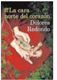
La cara norte del corazón Dolores Redondo. Destino