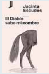
EL DIABLO SABE MI NOMBRE Autora: Jacinta Escudos. Ed.: Consonni. 118 páginas. Precio: 15,50 euros

‘Kim Ji-young, nacida en 1982’ es una perturbadora novela de Cho Nam-joo, que tiene por protagonista a una joven compatriota que en principio parece una mujer normal y corriente, un típico producto de la sociedad coreana de finales del XX y principios del XXI, que lleva el nombre más común entre las mujeres de Corea del Sur nacidas en ese año del título. Nada parece llamativo en su vida hasta que esta comienza a verse profundamente alterada cuando de pronto comienza a hablar con las voces de su propia madre, de una amiga desaparecida y de otras muchas mujeres. Es así como lo que en principio parecía una broma va adquiriendo el cariz de una forma de insurrección para algunos de las personas que la rodean y de enfermedad para otras.