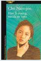
KIM JI-YOUNG, NACIDA EN 1982 Autora: Cho Nam-joo. Ed.: Alfaguara. 158 páginas. Precio: 16,90 euros (ebook, 7,99)

‘Kim Ji-young, nacida en 1982’ es una perturbadora novela de Cho Nam-joo, que tiene por protagonista a una joven compatriota que en principio parece una mujer normal y corriente, un típico producto de la sociedad coreana de finales del XX y principios del XXI, que lleva el nombre más común entre las mujeres de Corea del Sur nacidas en ese año del título. Nada parece llamativo en su vida hasta que esta comienza a verse profundamente alterada cuando de pronto comienza a hablar con las voces de su propia madre, de una amiga desaparecida y de otras muchas mujeres. Es así como lo que en principio parecía una broma va adquiriendo el cariz de una forma de insurrección para algunos de las personas que la rodean y de enfermedad para otras.