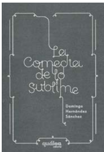
LA COMEDIA DE LO SUBLIME. Quálea / 208 páginas / 19,95 euros

Aunque los filósofos muerden, su hambre —fecha de caducidad en el DNI, ni rastro de colmillos— no nos inyecta ipso facto el ansia de dudar. En cambio, Domingo Hernández nos inyecta el veneno de las teorías y las notas al pie: en los cuatro actos que componen La comedia de lo sublime logra que el adjetivo alto , junto a pensamiento , no se dispare hasta la estratosfera, sino que nos coloca qué piensa, cómo y por qué —o todo lo contrario— en la palma de las manos. Comprimiéndolo en un zip , y bajo el riesgo de simplificar de más, de sublime se califica aquello que consideramos arte —excelso—, mientras los museos no reservan paredes para el humor. Ante esto, Hernández tira de la manta: invierte y mezcla lo sublime y lo cómico; salta a qué pinta lo pintoresco entre folletos trilingües; no se esconde bajo la manta susodicha para hablar de qué no se considera sublime y qué sí quizá humor o qué sí —seguro— arte, o del dolor de más que ronda el dolor de menos. «Lo sublime», advirtió Hernández Sánchez desde la primera frase, «siempre está de moda». Está lo que nos gusta, está lo que nos hace reír, están ambos: ¿cómo se casan, cómo se divorcian? Aquí las respuestas. ¿O más bien las preguntas?