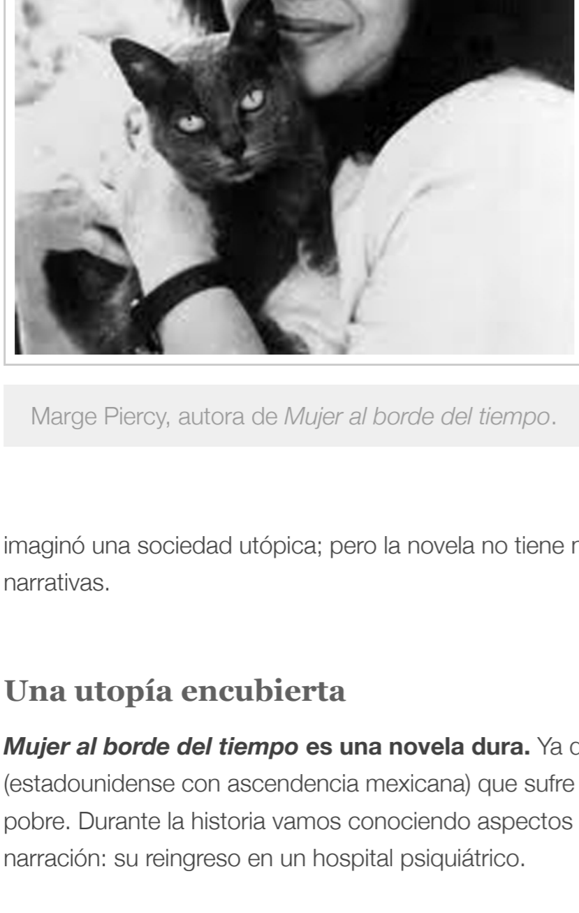
Marge Piercy, autora de Mujer al borde del tiempo .