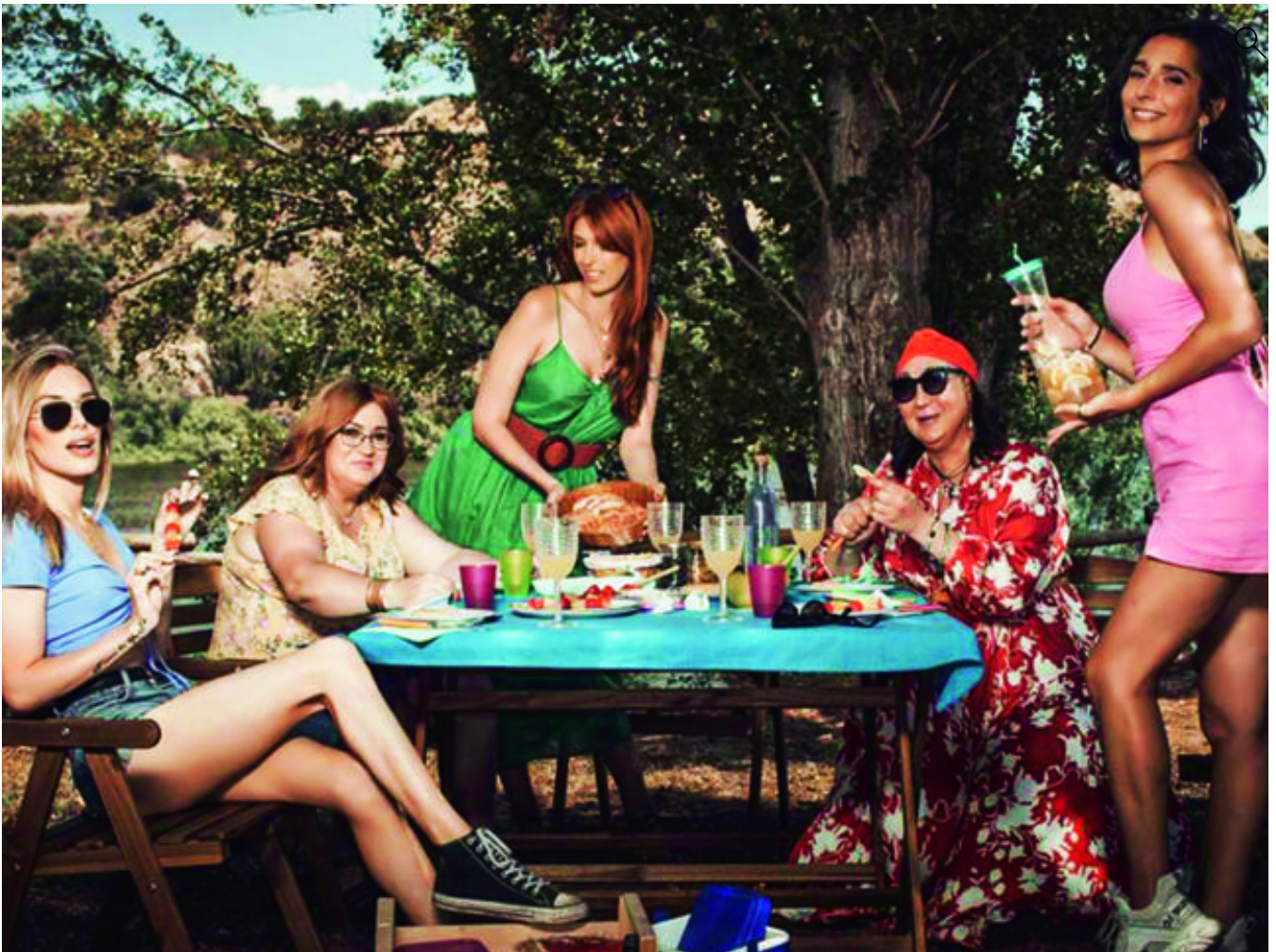
Serie Ellas (Atresplayer Premium).

SENADORA SARAH MCBRIDE: Es la primera senadora transgénero en la historia política de los Estados Unidos. Candidata demócrata en el estado de Delaware, ganó por un 73% de los votos y es la primera persona LGTBIQ electa en su distrito. Y solo tiene 30 años.