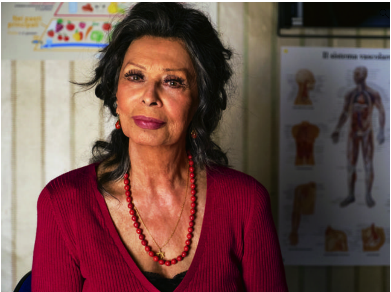
La actriz Sophia Loren.