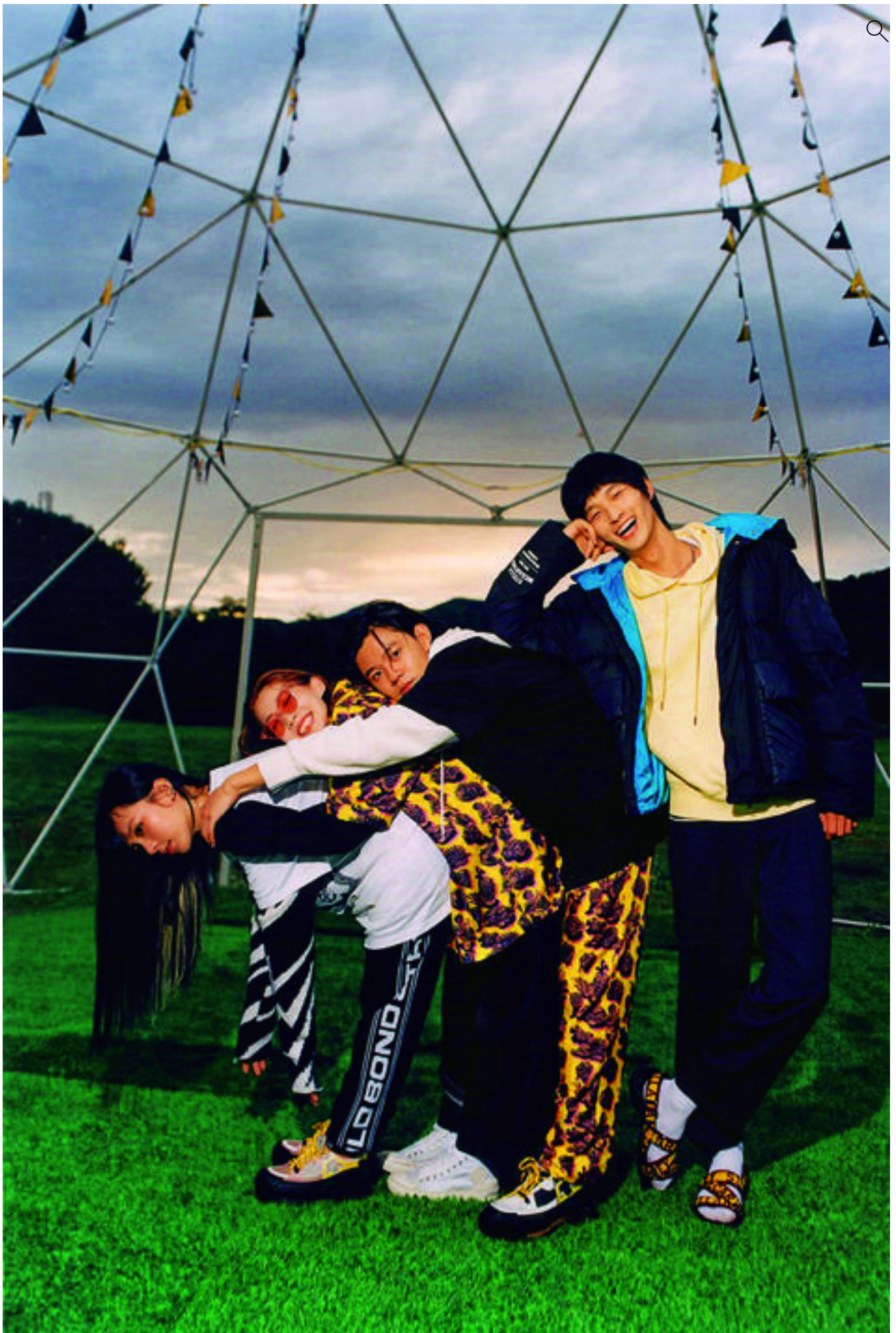
La colección sin género de Stella McCartney.