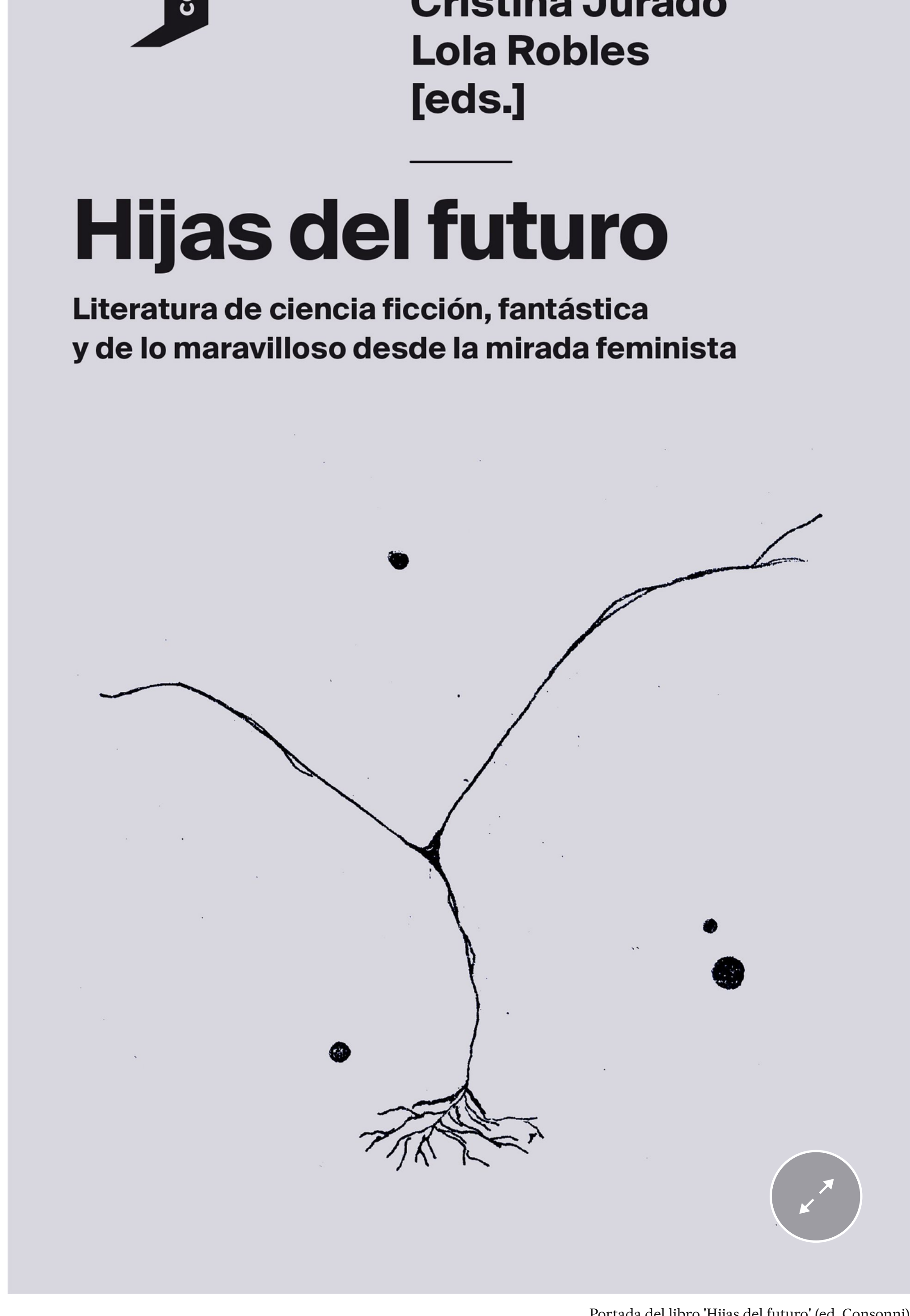
Portada del libro 'Hijas del futuro' (ed. Consonni), CONSONNI