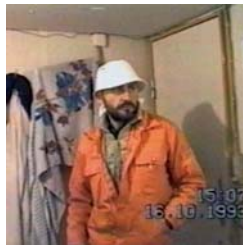
Vikingland Xurxo Chirro 99' (España, 2012)