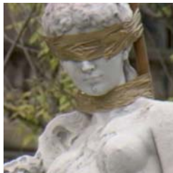
ElectroClass María Ruido 53' (España, 2011)