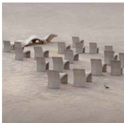
Mercado de Futuros Mercedes Álvarez 110' (España, 2011)