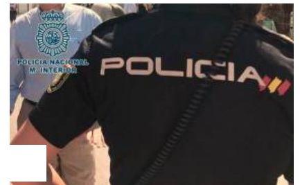
Se entrega tras matar a su padre a golpes con una barra de hierro