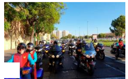
Sevilla suena a 'Goldwing'