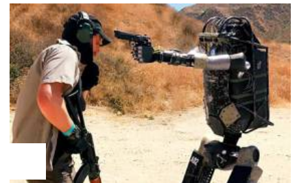
El increíble vídeo de un robot soldado que ha dado la vuelta al mundo