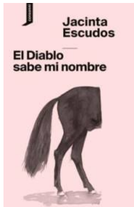
Portada de 'El diablo sabe mi nombre'.

Destacan, «Días del fin» (el fin del mundo convertido en unas horas que mecen con tanta violencia como esperanza, en los que el recuerdo que tengamos de nosotros mismos nos convierta en seres inmortales), «Muerto al lado de mí mismo» (la realidad paralela como escenario alternativo) y el relato que da nombre al libro «El diablo sabe mi nombre» (el amor del diablo en pleno apogeo). Pero en todos encontramos imágenes poderosas, una poética en busca de la verdad literaria y un esfuerzo por ensanchar la realidad con eso que creemos que no existe y que, sin embargo, invade todo lo que somos, con los sueños, con la imaginación, con lo imposible.