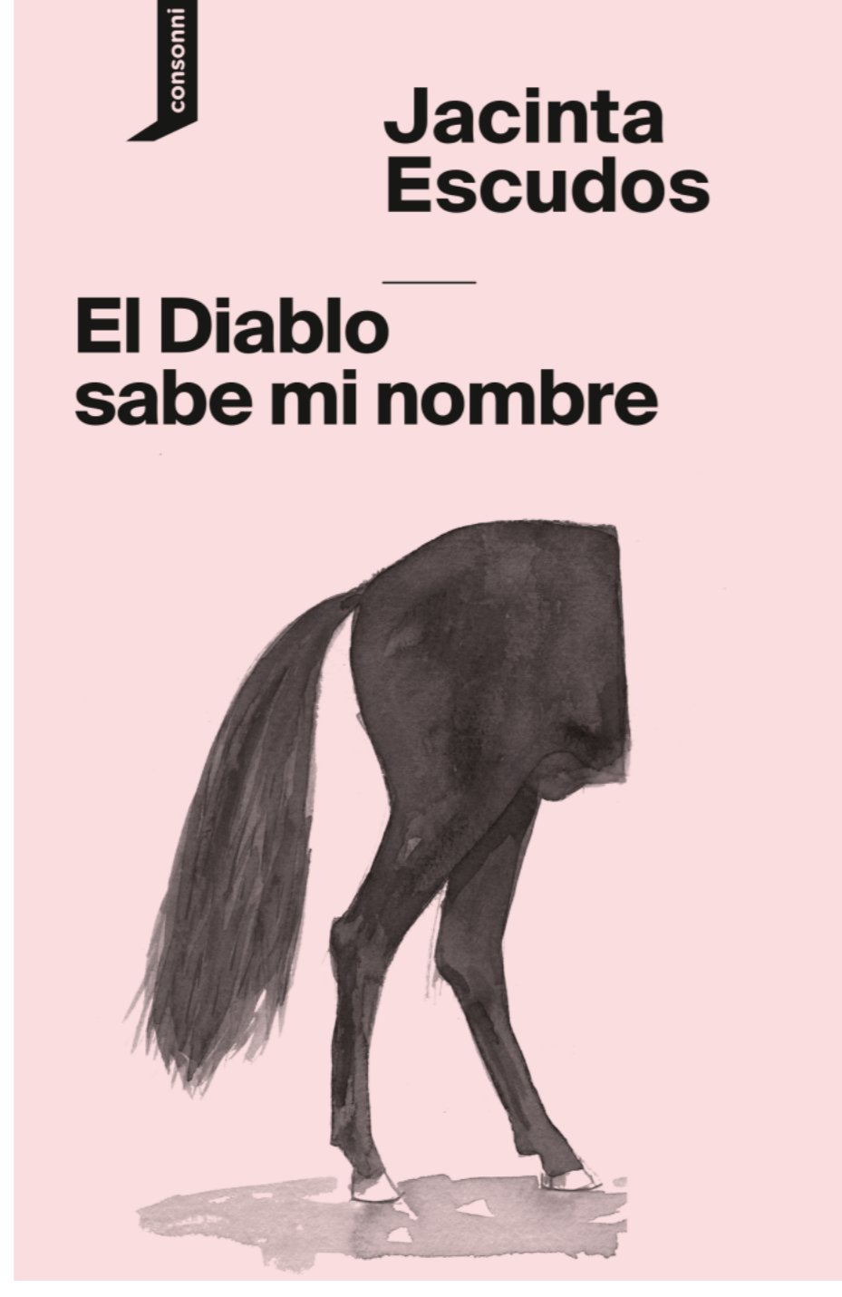
Portada de Escif

Todos los relatos son reseñables, por la experiencia onírica que te trasladan y su forma de cambiar el género y la forma a sus personajes, a pesar de que mi preferido ha sido el que da nombre a esta compilación, El diablo sabe mi nombre , la sorpresa y reflexión ha sido ante el relato La flor del Espíritu Santo , donde te enfrentas a una realidad que antes parecía lejana y ahora, por desgracia es familiar.