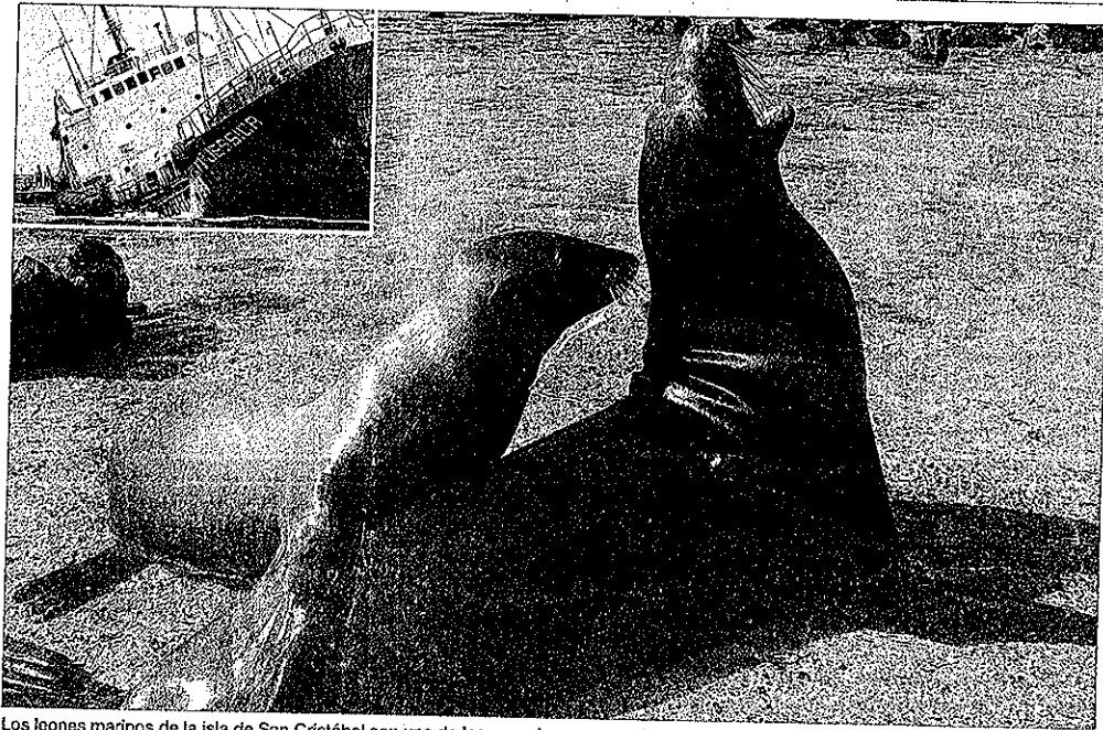
Los leones marinos de la isla de San Cristóbal son una de las especies amenazada por el derrame.