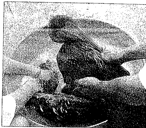
Veterinarios bañan a un pelícano contaminado.